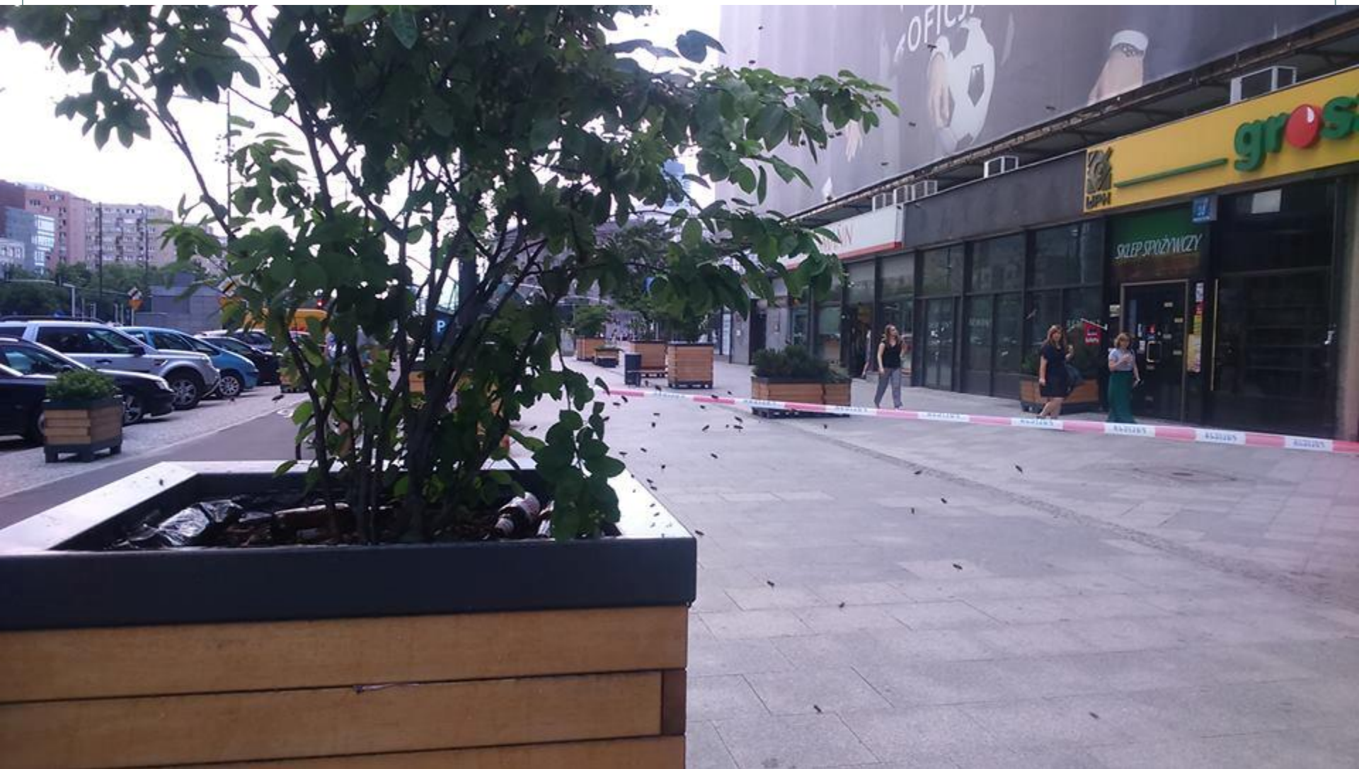
fot. Piotr Nowotnik